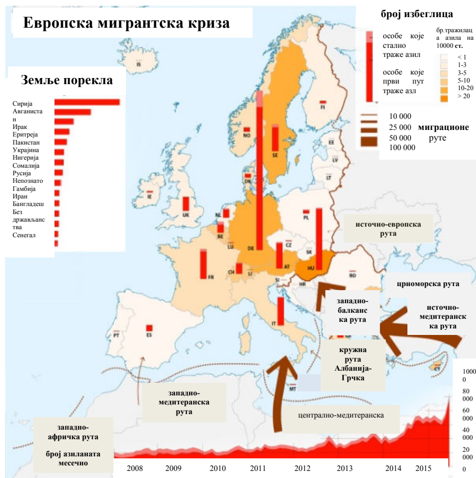
Слика 1. – Миграционе руте и земље порекла тражиоца азила 2015. године (znanost.metinalista.si)

стило своју земљу; 2, 2 милиона Сиријаца налази у Египту, Ираку, Јордану и Либану; 1, 9 милиона у Турској; 24 хиљаде у Либији; 8 % Сиријаца стигло у Европу; 500 000 миграната прешло спољне границе Европске уније од јануара до августа 2015. године - 54 % њих чине Сиријци; 213 000 од априла до јуна 2015. године затражило азил по прву пут у ЕУ, што је 85 % више него у истом периоду 2014. године; 592 000 људи крајем јуна 2015. године чекало на одобрење заштите у ЕУ; 305 800 (52 %) захтева за азил поднето у Немачкој; 56 000 у Шведској; 48 300 у Италији; 36 100 у Француској; 29 400 у Великој Британији; 29 200 у Грчкој; 2 600 миграната, према подацима Међународне организације за миграције (ИОМ), се удавило