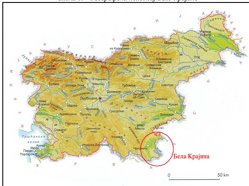
Слика 1. – Географски положај Беле Крајине