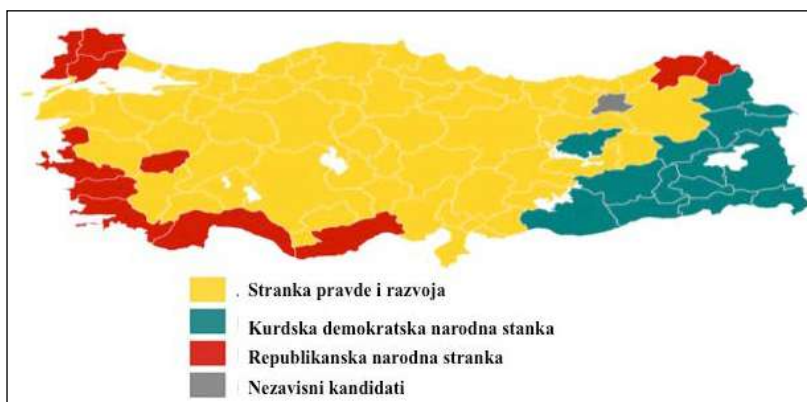
Slika 2. Rezultati parlamentarnih izbora u Turskoj 2002. godine.